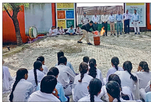
रेवाड़ी। सीहा स्कूल में आपदा प्रबंधन के गुर सीखते विद्यार्थी।