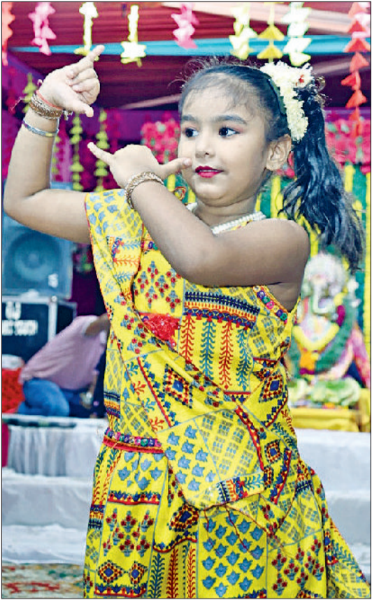
रेवाड़ी। श्री कृष्ण भजनों पर डांस करती बच्ची।

टीपी स्कीम में कृष्ण की मस्ती व मीरा की भक्ति में रंगा गणेशोत्सव