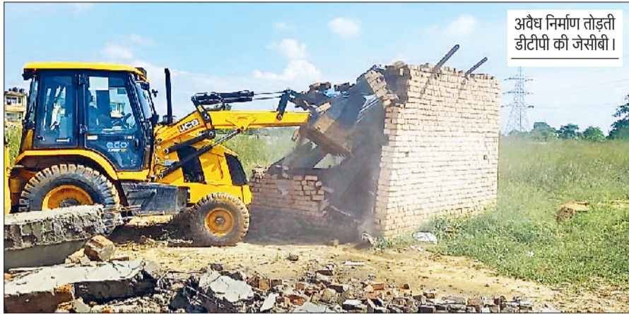
अवैध निर्माण तोड़ती डीटीपी की जेसीबी।

डीटीपी की इस कार्रवाई से अवैध रूप से निर्माण करने वाले व कॉलोनियों काटने वाले लोगों में खलबली मच गई। डीटीपी ने बिना अनुमति कॉलोनियों विकसित करने वाले व प्लॉटिंग के बाद निर्माण करने वाले लोगों के खिलाफ कार्रवाई तेज की हुई है। वीरवार को डीटीपी की टीम