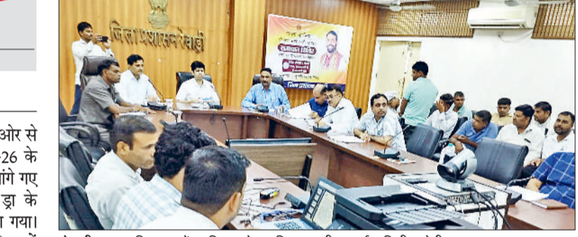
रेवाड़ी। लघु सचिवालय में ड्रा निकालते हुए जिला स्तरीय कार्यकारिणी कमेटी।