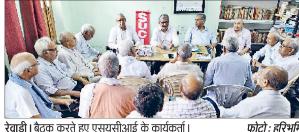
रेवाड़ी। बैठक करते हुए एसयूसीआई के कार्यकर्ता।