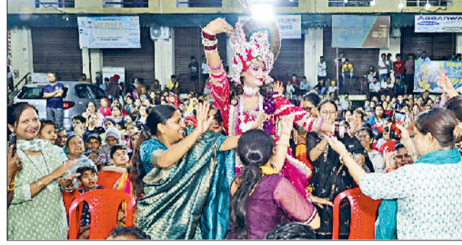
रेवाड़ी। कृष्ण बने कलाकार के साथ डांस करती महिलाएं।