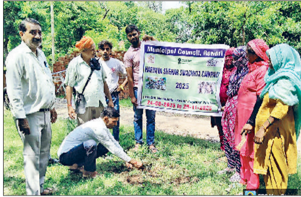
रेवाड़ी। स्वच्छता मुहिम के तहत पार्क में पौधरोपण करते हुए नए टीम व सफाई अभियान के नोडल अधिकारी शहरवासियों को सफाई के प्रति जागरूक करते हुए।