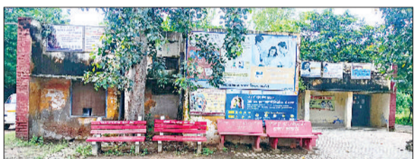
नांगल चौधरी। सामुदायिक स्वास्थ्य केंद्र का कंडम भवन।

सामुदायिक स्वास्थ्य केंद्र नांगल चौधरी को जल्द ही नई बिल्डिंग मिलेगी। इसके लिए विभाग के चीफ आर्किटेक्ट ने बिल्डिंग के ड्राफ्टिंग मैप में जरूरी औपचारिकताएं पूरी की व फाइल को मंजूरी दे दी। अब नक्शा फाइल को पीडब्ल्यूडी विभाग के पास भेजा गया है, साथ स्वीकृत बजट का पत्र संगलन कर दिया। जिसके अनुसार जल्द ही बिल्डिंग निर्माण शुरू कराने के निर्देश दिए गए हैं। भवन निर्माण की प्रक्रिया में भूकंपरोधी तकनीक का इस्तेमाल करने की विशेष हिदायत दी गई है।